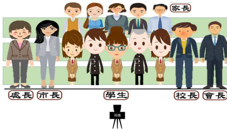
第一組合照示意圖