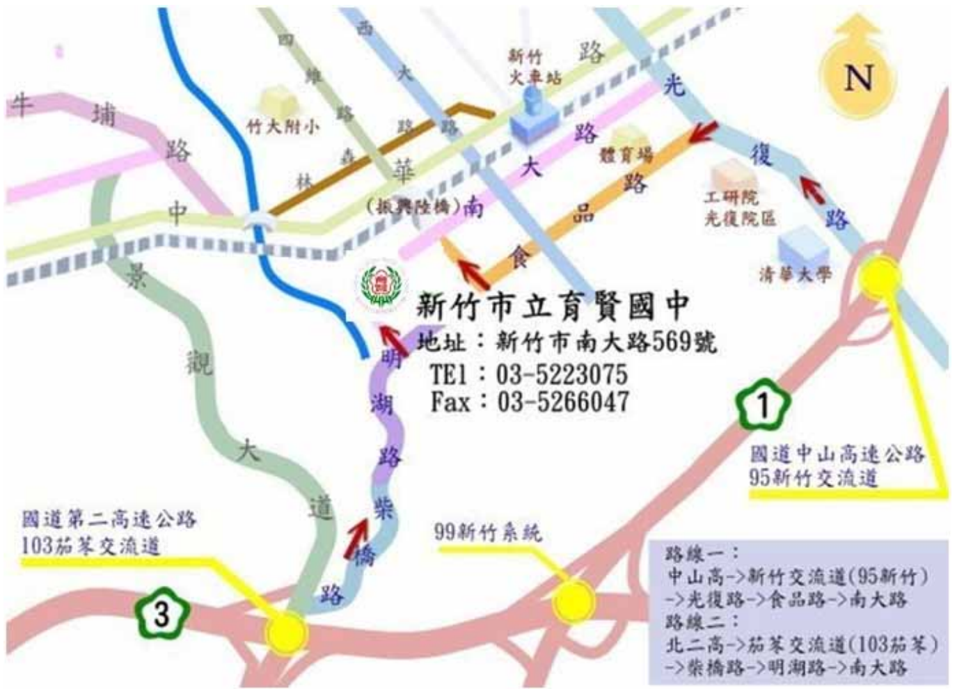
圖一：育賢國中校地位置圖