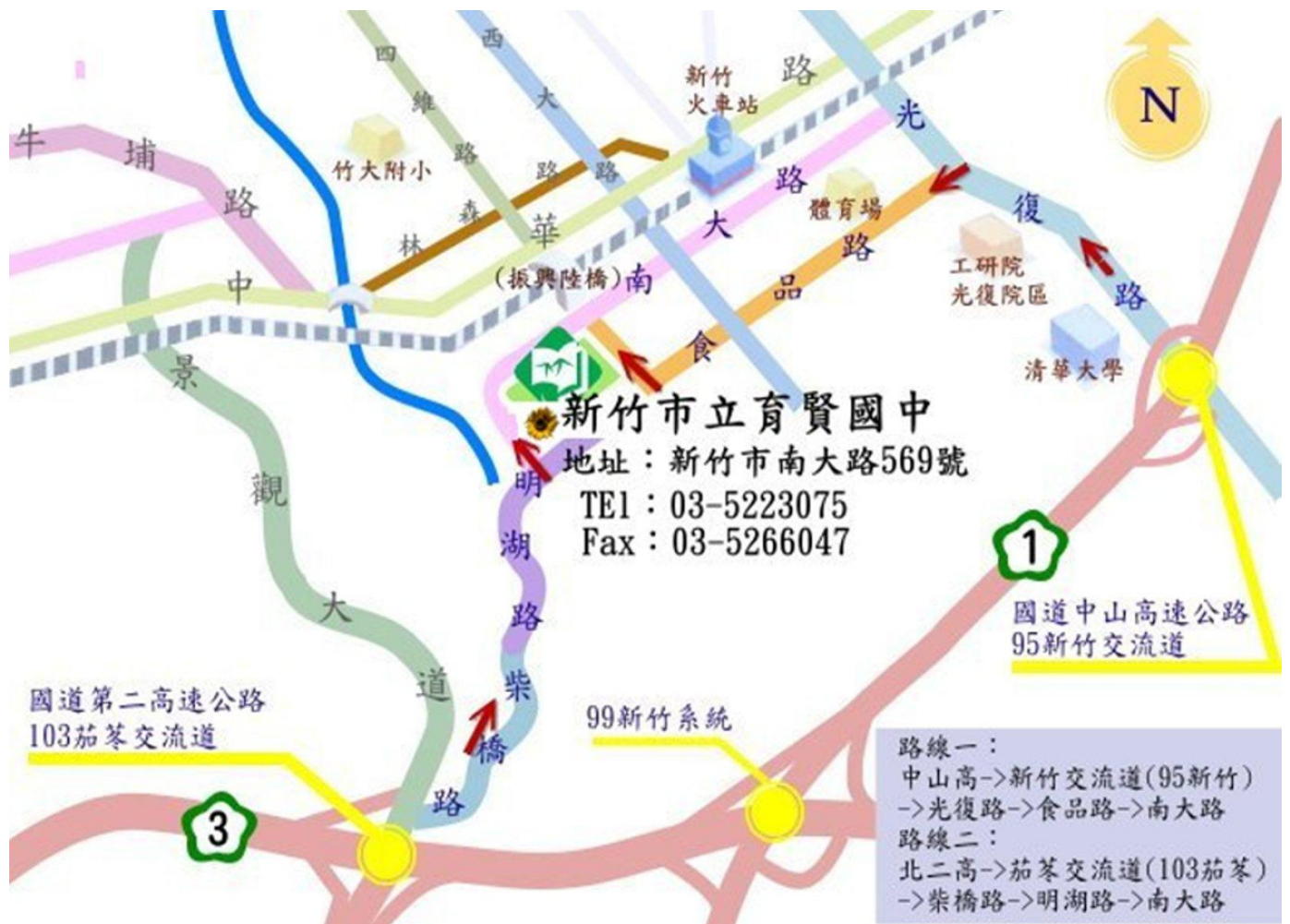
圖一：育賢國中校地位置圖